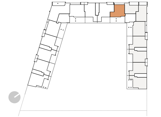
PLANTA 5ª Y BAJOCUBIERTA